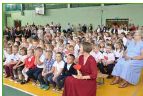
Rozpoczęcie roku w ZS w Bratianie