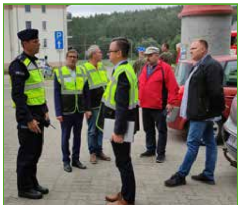
Meldunek. Zakończenie ćwiczeń

Cała akcja odbyła się w ramach ćwiczeń obronnych Nowomiejski Wrzesień 2022, które objęły również inne samorządy na terenie powiatu.