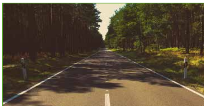
Zajęcie pasa drogowego

Więcej na temat zajęcia pasa na stronie internetowej Zarządu Dróg Wojewódzkich. Informacji na temat zajęcia pasa drogowego dróg gminnych udziela Referat Drogownictwa UG w Mszanowie.