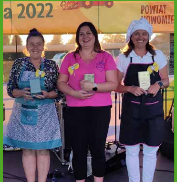
Festiwal Zdrowej Żywności z KGW