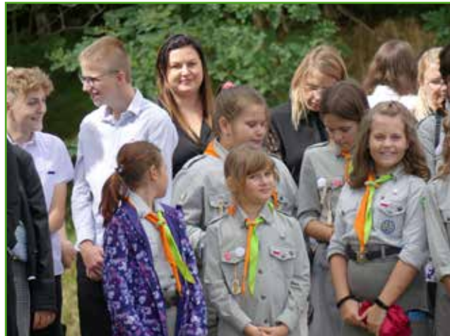
Harcerze na uroczystości rocznicowej