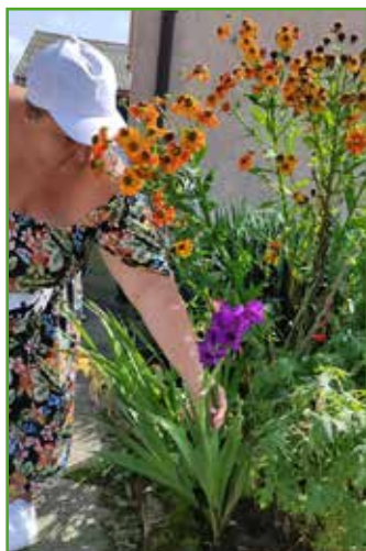
Ocena ogrodowych nasadzeń