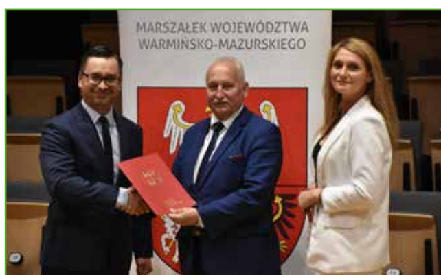
Rozpoczęcie roku w SP w Jamielniku

Podpisanie umowy odbyło się 8 sierpnia 2022 r. w Urzędzie Marszałkowskim w Olsztynie.