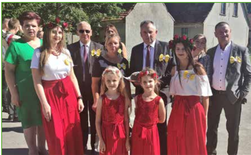
Gospodarze tegorocznych dożynek