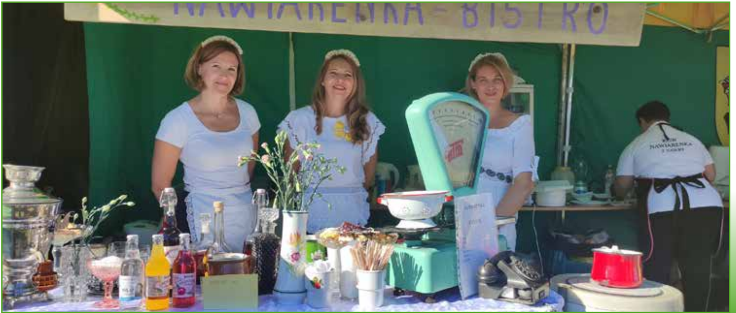
Nagrodzone stoisko Nawiarenki