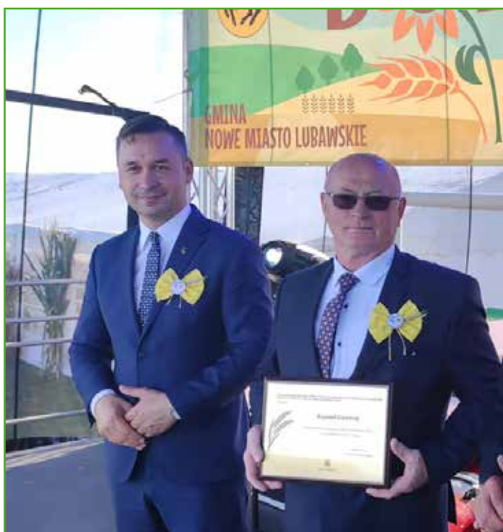
Nagrody dla rolników