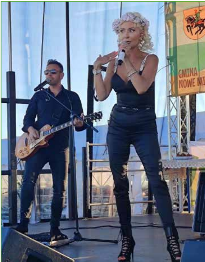
Na scenie zespół Mejk