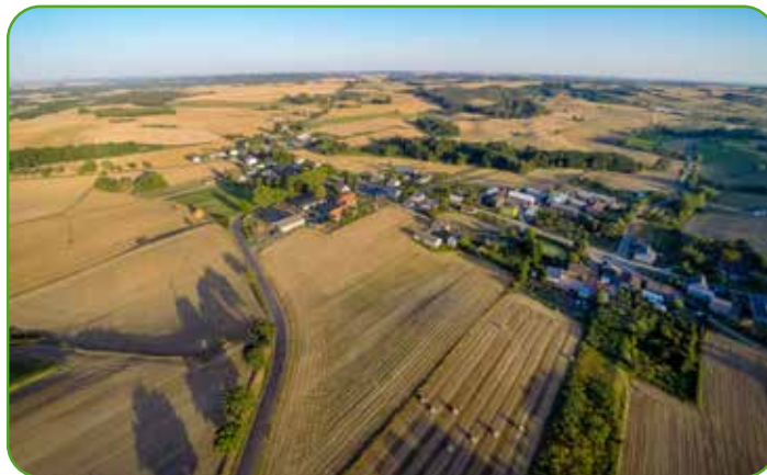
Nowy Dwór Bratiański