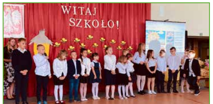
Rozpoczęcie roku w SP w Gwiździnach