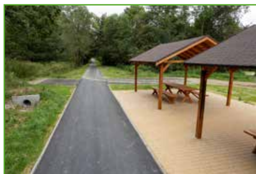
Wiaty z ławkami

W dalszym ciągu trwają intensywne prace na ścieżce rowerowej Tylice-Pacóttowo. Póki co możemy się pochwalić warstwą asfaltową na niemal całym odcinku ścieżki, zatoczkami a także wiatami. Przypominamy też, że długość ścieżki to ponad 5 km.