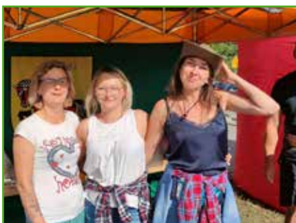
Stoisko KGW Gryźliny