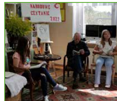
Narodowe Czytanie 2022

Jednak wszyscy zgromadzeni w sali biblioteki w Jamielniku, jak jeden mąż, zastłuchali się w „Balladach i romansach” Adama Mickiewicza. Biblioteka Publiczna w Jamielniku wzięła udział w Narodowym Czytaniu 2022. Dobór utworów był bardzo urozmaicony. Część wzbudzała lęk i niepokój, część przypominała nam, że nie ma zbrodni bez kary... Aby jednak nie opuszczać spotkania w ponurych nastrojach, na zakończenie wystłuchano „Pani Twardowskiej”, która wywołała uśmiechy na twarzach wszystkich zgromadzonych.