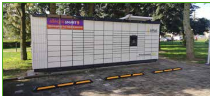
Paczkomat na małym parkingu

Zastanawiasz się, jak szybko i korzystnie wysłać przesyłkę? Chcesz do maksimum uprościć ten proces i nadawać paczki w dowolnym momencie bez względu na porę dnia lub dzień tygodnia? Możesz to teraz zrobić w Mszanowie. Na małym parkingu przy urzędzie gminy stanął paczkomat In Post.