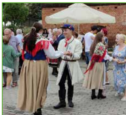
Tańczący uczestnicy i publiczność

Impreza super - zabawa super - towarzystwo super - jednym słowem SUPER - dziękujemy bardzo! Podsumował imprezę zespół „Laskowianki, który przyjechał do Tylic aż z Podlasia.