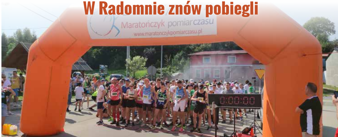
Zawodnicy na starcie

W imieniu wszystkich członków grupy Radomno Biega składamy serdeczne podziękowania wszystkim uczestnikom zarówno tych biegającym jak i kibicującym za udział w tegorocznym biegu. Dziękujemy sponsorom, dzięki którym nie byłoby możliwe przygotowanie imprezy na takim poziomie(...) Państwa obecność była dla nas niezwykle ważna. Mamy nadzieję, że będziecie Państwo wspominać ten dzień z przyjemnością. – słowa podziękowania zamieścili na swoim profilu Facebook.