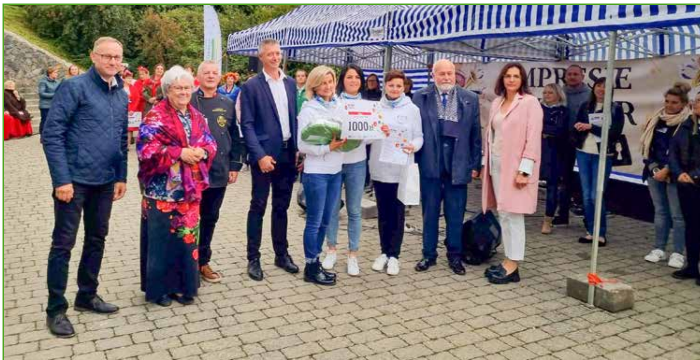
I miejsce dla KGW Mszanowo

„Bitwa Regionów” to konkurs kulinarny dla Kół Gospodyń Wiejskich, zorganizowany przez Ministra Rolnictwa i Rozwoju Wsi oraz Krajowy Ośrodek Wsparcia Rolnictwa przy wsparciu Agencji Restrukturyzacji i Modernizacji Rolnictwa oraz Kasy Rolniczego Ubezpieczenia Społecznego.