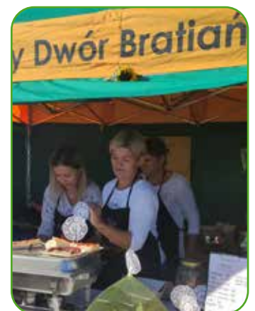
Koło Gospodyń Wiejskich

Obecnie wieś liczy sobie 223 mieszkańców. Działa w niej Ochotnicza Straż Pożarna oraz Koło Gospodyń Wiejskich, które to organizacje aktywnie działają w zakresie integracji mieszkańców podczas takich wydarzeń jak m.in. Dni Rodziny, Dzień Kobiet czy Dzień Seniora. KGW bierze również udział w wielu imprezach organizowanych przez gminę. Można wtedy spróbować przysmaków przygotowanych przez gospodynie.