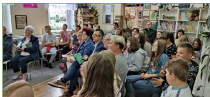
Uczestnicy Narodowego Czytania 2022