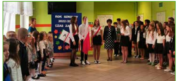
Rozpoczęcie roku SSP w Tylicach