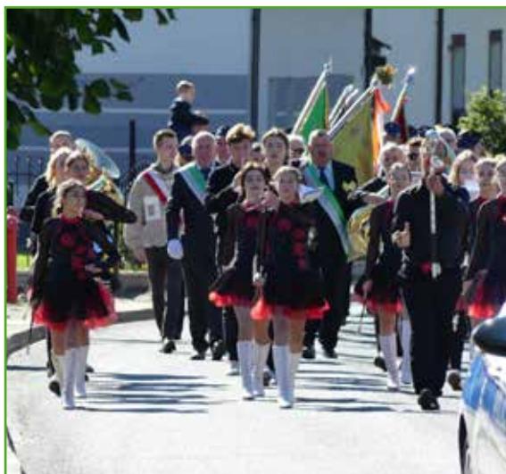
Przemarsz z orkiestrą