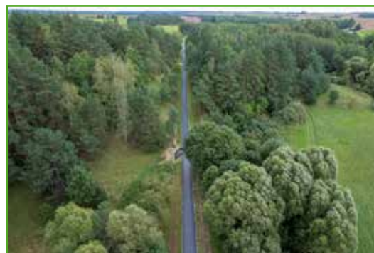
Co nowego na ścieżce?