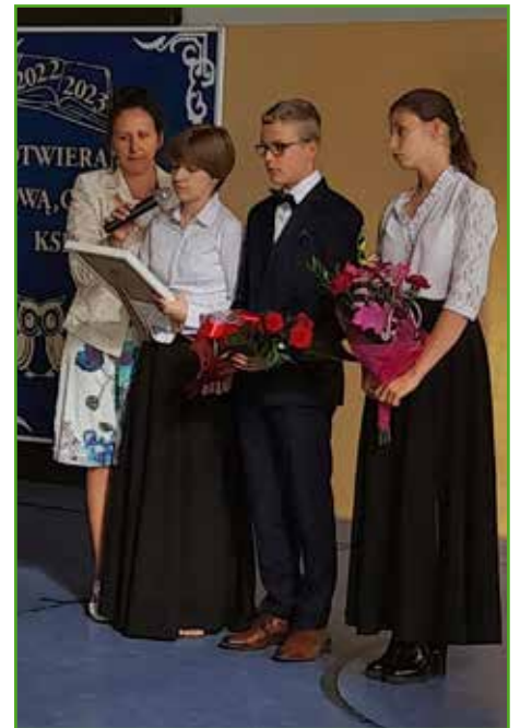
Rozpoczęcie roku SP w Radomnie