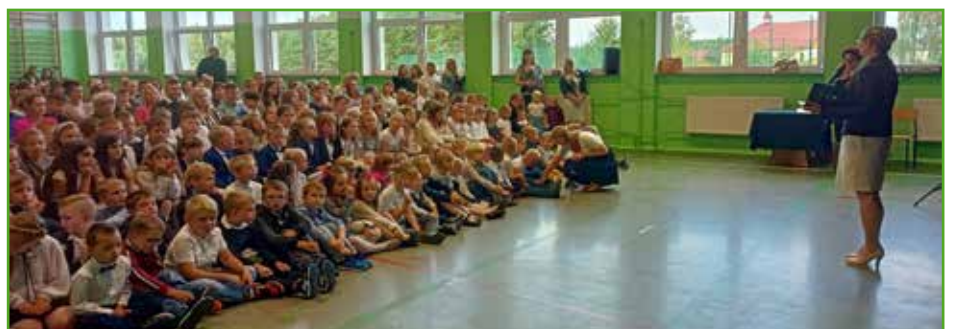
Rozpoczęcie roku w SP w Jamielniku