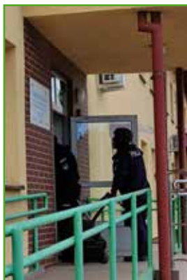
Ekipa poszukująca bomby