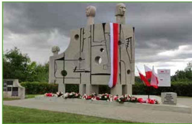
Pomnik Ściana Śmierci w Nawrze

Tego dnia rozstrzygnięto również konkurs literacki pt. „Nasze jutro – twoje dziś” zorganizowany przez Stowarzyszenie Wspierające Rozwój Wsi Jamielnik dla uczniów szkół gminy i miasta Nowe Miasto Lubawskie.