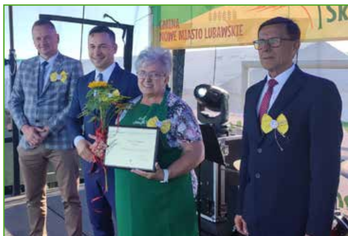
Wyróżnienia dla KGW