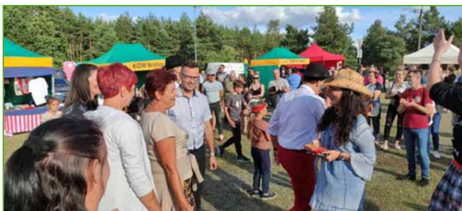
Publiczność na Bratian Country Festival

To nowa propozycja Gminy Nowe Miasto Lubawskie i Gminnego Centrum Kultury w Mszanowie, które stara się oferować mieszkańcom zróżnicowaną ofertę kulturalną. Kto wie, być może Bratian Country Fest na stałe wpisze się w kalendarz gminnych imprez.