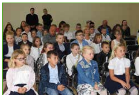
Rozpoczęcie roku w SP w Skarlinie