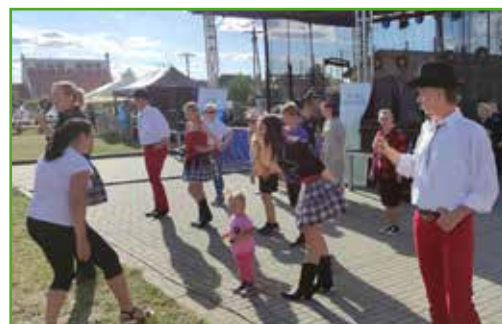
Nauka tańca liniowego