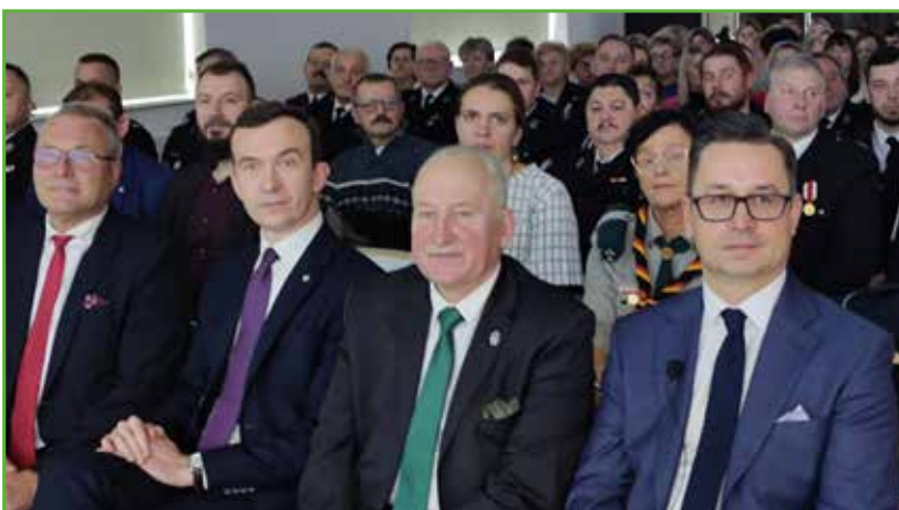
Wśród gości senator i wicemarszałek