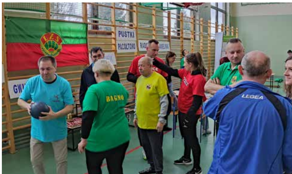
Za czym kolejka ta stoi

W tym roku na szczycie podium uplasowało się sołectwo Tylice. Tuż za