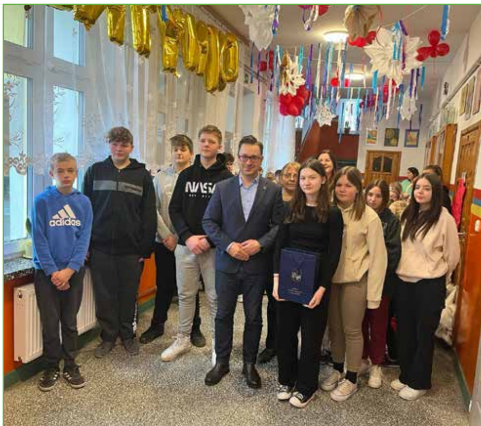
Uczniowie SP w Skarlinie

Na początku lutego wójt gminy wraz z Dyrektorem OPS w Mszarnowie spotkali się z laureatami IV Gminnego Konkursu Plastycznego „Przemocy - STOP”.