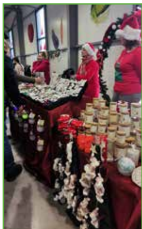
Stoisko ze świątecznymi ozdobami

Tymczasem zapraszamy na pierwszy Jarmark z Zającem już 17 marca w Hali Targowej w Bratianie.