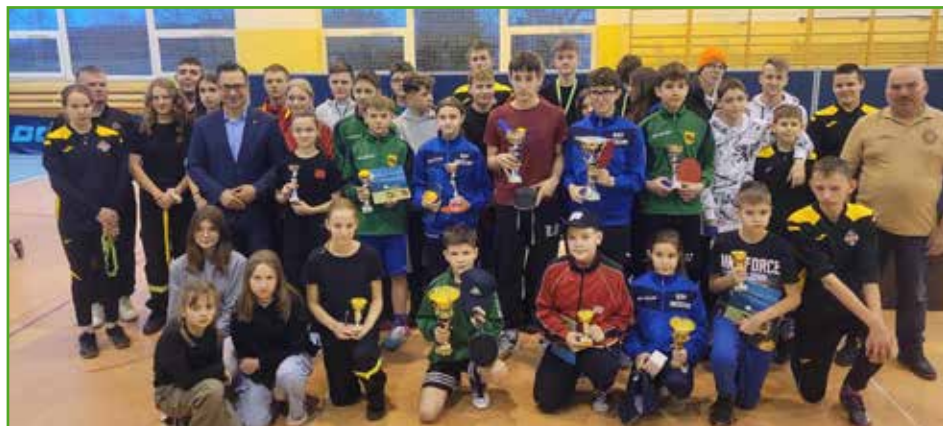
Zdjęcie drużyn po zakończeniu turnieju