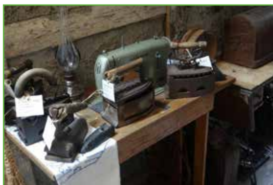
Stare żelazka jako ekspozycje

Zarchiwizowane dokumenty można obejrzeć na https://zbioryspoleczne.pl/archiwa/PL_2032