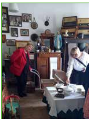
Z wizytą w Lokalnej Izbie Pamięci