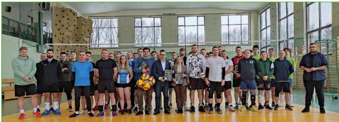
Uczestnicy turnieju na wspólnym zdjęciu