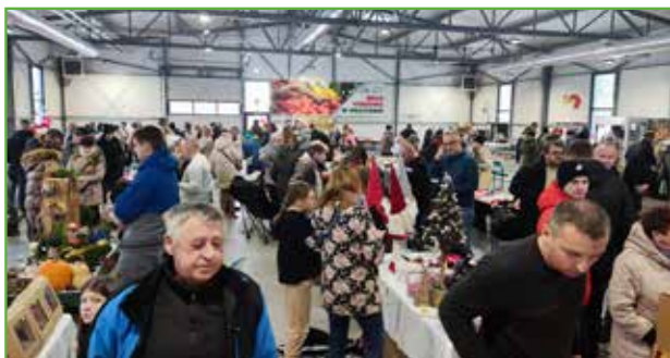
Wypełniona hala podczas jarmarku