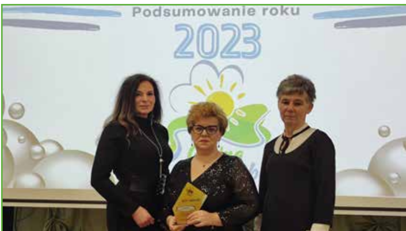
Laur dla KGW Jamielnik